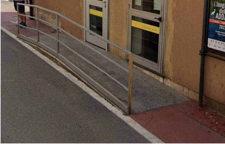
Rampa d'accesso Ufficio Postale

COMUNE DI VERDERIO PROT. N.0004390 DEL 15-04-2024 CAT 6 CL 2 IN arrivo